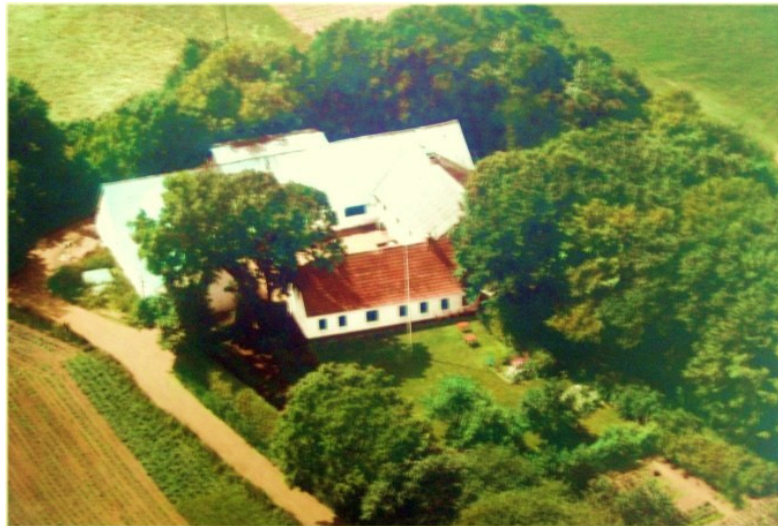
Nørre Rævbak ved Østervrå