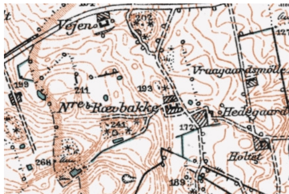
Østervrå Lokallistoriske Forening