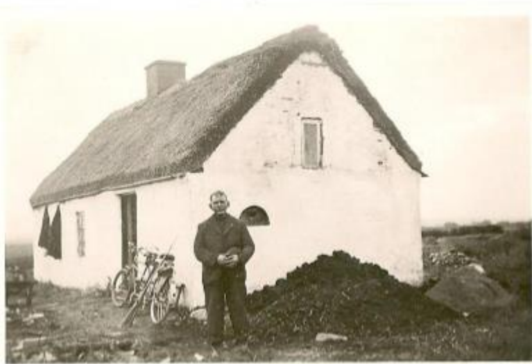
Albert Nørkjærs hus